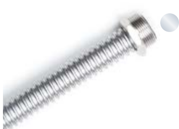
Außengewinde DIN EN 10226-1 Male thread DIN EN 10226-1