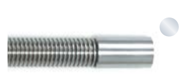
Angeschweißter Edelstahlrohrstutzen Welded stainless steel pipe neck