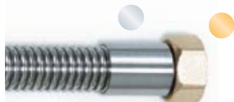
Nippel mit Überwurfmutter, flach dichtend, oder Dichtkegel Nipple with union nut flat sealed or conical fitting