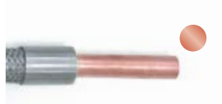
Angelöteter Kupferrohrstutzen Soldered copper pipe neck