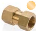
Stauchring- verschraubung/ G-Innengewinde Compression ring connection/ female G-thread MSI