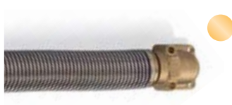
Angelöteter Messingflansch, alternativ: torsionsfrei Soldered brass flange, alternative: torsion-free