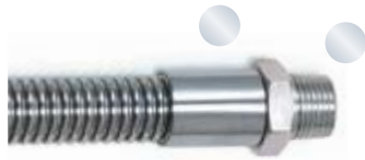
Fest montiertes Außengewinde R, G, NPT Fixed male thread R, G, NPT