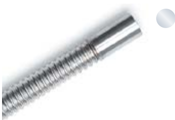
Angeschweißter Rohrstützen Welded pipe neck