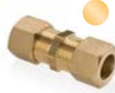
Stauchring- verschraubung Compression ring connection MSS