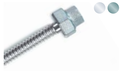
3-teilige Verschraubung 3-part screw joint