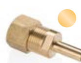
Stauchringverschraubung/ Lötanschluß Compression ring connection/ solder socket MSL