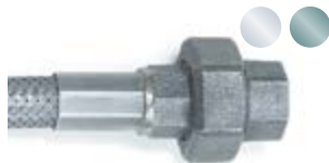
VA/Temperglass-Verschraubung, 3-teilig (Gasanschlusschlauch) Stainless steel/malleable cast iron fitting, 3-piece (gas hose)