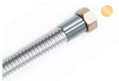
Überwurfmutter auf Bundnippel Union nut on connecting nipple