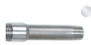
Angeschweißtes Spezialgewinde Welded special thread