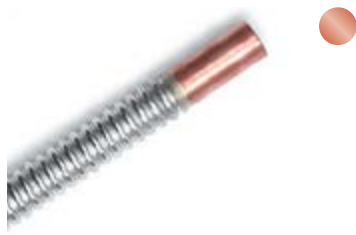
Angelöteter Rohrstützen Soldered pipe neck