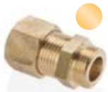
Stauchring- verschraubung/ G-Außengewinde Compression ring connection/ male G-thread MSA