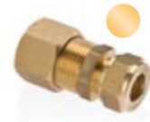
Stauchringverschraubung/ Klemmring- verschraubung für Cu-Rohr Compression ring connection/Clamping ring connection for copper tubes MSK